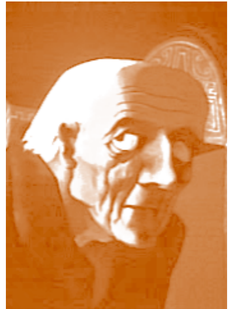
The Tell-Tale Heart Ted Parmelee 1953

Le poisson (enchanté) qu'il vient d'attraper propose à un vieil homme d'exaucer tous ses vœux en échange de sa liberté. D'après un conte en vers de Pouchkine, Le Conte du Pêcheur et du Petit Poisson .