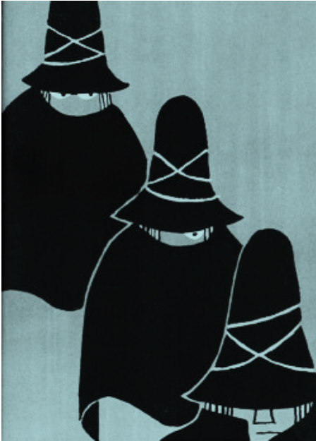
Les Trois Brigands Gene Deitch 1972

Il s'agit de la première adaptation du livre pour enfants éponyme ( Les Trois Brigands ) de Tomi Ungerer, publié en 1961. Ce court métrage d'animation de huit minutes se conforme fidèlement aux illustrations de Tomi Ungerer.