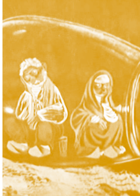
Le Poisson d'or Jiri Trnka 1951

Il s'agit de la première adaptation du livre pour enfants éponyme ( Les Trois Brigands ) de Tomi Ungerer, publié en 1961. Ce court métrage d'animation de huit minutes se conforme fidèlement aux illustrations de Tomi Ungerer.